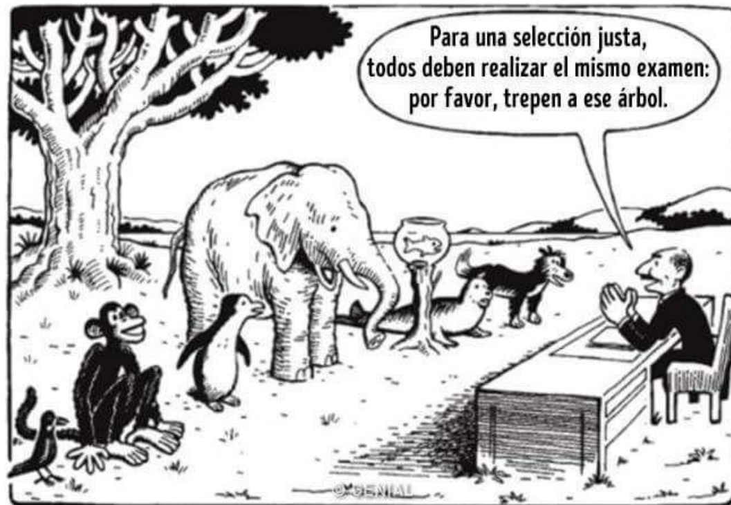
Un ejemplo de enseñanza no diferenciada

https://www.pinterest.com/pin/827606869000524365/